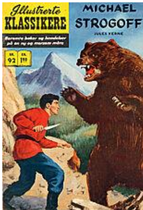
Illustrerte Klassikeres utgave av Vernes bok.

Boka er en slags spionroman eller actionroman av typen James Bond , full av sterke opptrinn og fargerike bipersoner. Teksten er oversatt i sin helhet av Tom Lotherington , og Per Johan Moe har skrevet et grundig etterord. I løpet av våren kommer « Reisen til månen » og « Den hemmelighetsfulle øya ».