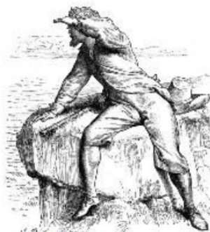
SPEIDER FORGJEVES: Robinson Crusoe kikker ut mot horisonten, uten å se annet enn hav og atter hav. Tegning av J.D. Watson.

I SIN BOK tegner og skildrer hun 50 øyer fulle av spennende detaljer som appellerer til fantasien og den øde øya i sjelen vi all lengter etter, men neppe kommer til å finne.